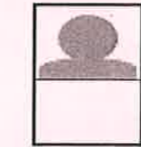
縦横の比率があていないもの