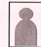
全身写真になっているもの