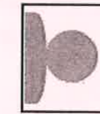
写真が横向きになっているもの